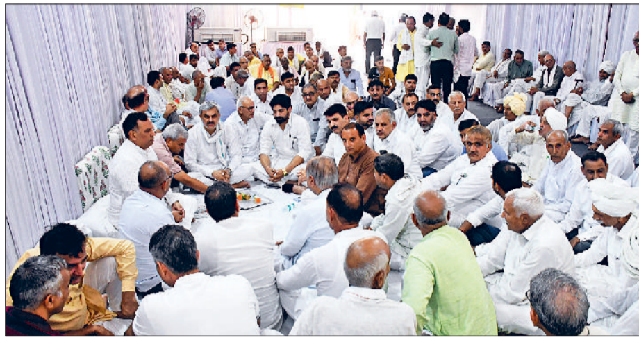
रोहतक। सिंधु भवन में शोक जताने पहुंचे अलग-अलग जिलों के गणमान्य लोग।