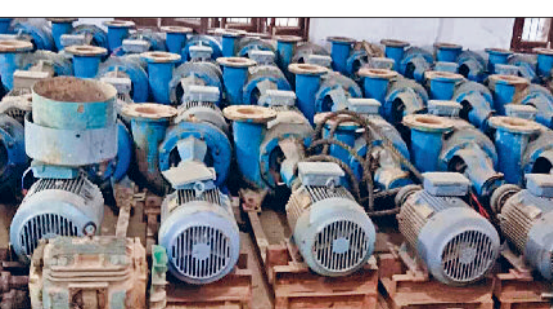
रोहतक। फाईल फोटो

20-25 साल से ड्रेन नंबर 8 के ओवरफ्लो होने पर थिलोडू कलां-थिलोडू खुर्द, काहनी, जसिया, सांधी, छिछड़ाना, रूखी, मकड़ौली कलां, मकड़ौली खुर्द-मकड़ौली कलां, बसंतपुर समेत आसपास के दूसरे गांवों में मानसून में फसलें तबाह हो रही हैं। वजह है ड्रेन आठ के ओवरफ्लो होने पर जसिया ड्रेन का पानी खेतों में बैक मार देता है। लेकिन इस बार ऐसा नहीं होगा। ये दावा सिंचाई विभाग का है। महकमे का कहना है कि आगामी 31 जुलाई तक सुंदरपुर गांव में, जहां जसिया ड्रेन ड्रेन नंबर आठ में मिलती है,