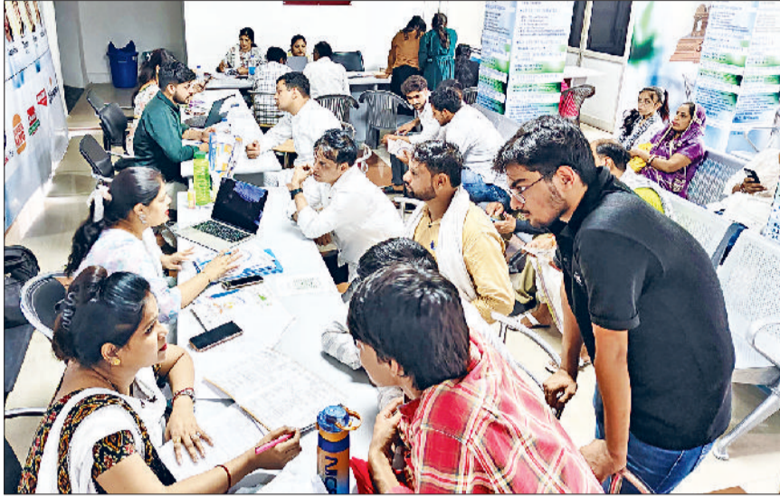
रोहतक। बीएमयू के एडमिशन सेल पर विभिन्न कोर्सों में एडमिशन लेने पहुंचे छात्र-छात्राएं।

हरियाणा ही नहीं, बल्कि उत्तर भारत के कई राज्यों से छात्र बाबा मस्तनाथ विश्वविद्यालय में दाखिला लेने के लिए आगे बढ़ रहे हैं। विश्वविद्यालय में दाखिले के लिए चल रही प्रक्रिया के दौरान छात्रों का जो उत्साह देखा जा रहा है, वह इस बात का गवाह है कि यह संस्थान सिर्फ नाम से ही नहीं, बल्कि अपनी गुणवत्तापूर्ण शिक्षा और रोजगार के अवसरों के लिए भी प्रसिद्ध है। विश्वविद्यालय की नींव नाथ परंपरा की शिक्षा पर आधारित है, जो न केवल शिक्षा, बल्कि छात्रों में संस्कार, आत्मविश्वास और सामाजिक जिम्मेदारी भी विकसित करती है। इस विश्वविद्यालय की