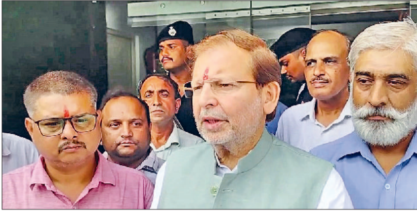
रोहतक। पत्रकारों से बातचीत करते कैबिनेट मंत्री डॉ अरविंद शर्मा।

प्रदेश के सहकारिता, कारागार, विरासत व पर्यटन मंत्री डॉ अरविंद शर्मा ने कहा कि प्रदेश में बदमाशों के लिए कोई स्थान नहीं है और मुख्यमंत्री नायब सैनी साफ कर चुके हैं कि या तो बदमाश हरियाणा छोड़ दें या फिर सरकार उन्हें नहीं छोड़ेगी। पूर्व उपमुख्यमंत्री दुष्यंत चौटाला के बयान को लेकर भी कैबिनेट मंत्री ने प्रतिक्रिया देते हुए कहा कि दुष्यंत चौटाला उप मुख्यमंत्री रह चुके हैं और सरकार का भी हिस्सा रहे हैं। अगर उन्हें यह पता है कि यह अधिकारी बदमाशों के साथ मिलीभगत किए हुए हैं तो वह मुख्यमंत्री से मिलकर कार्रवाई करवाए, क्योंकि सरकार कानून व्यवस्था को लेकर पूरी तरह से गंभीर है।